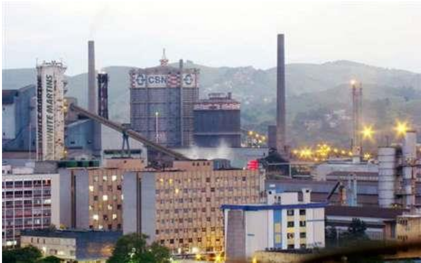
CSN – Volta Redonda