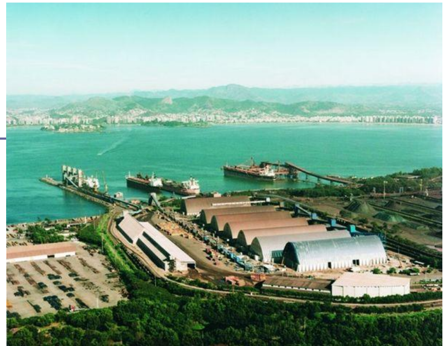
Cia. Vale do Rio Doce